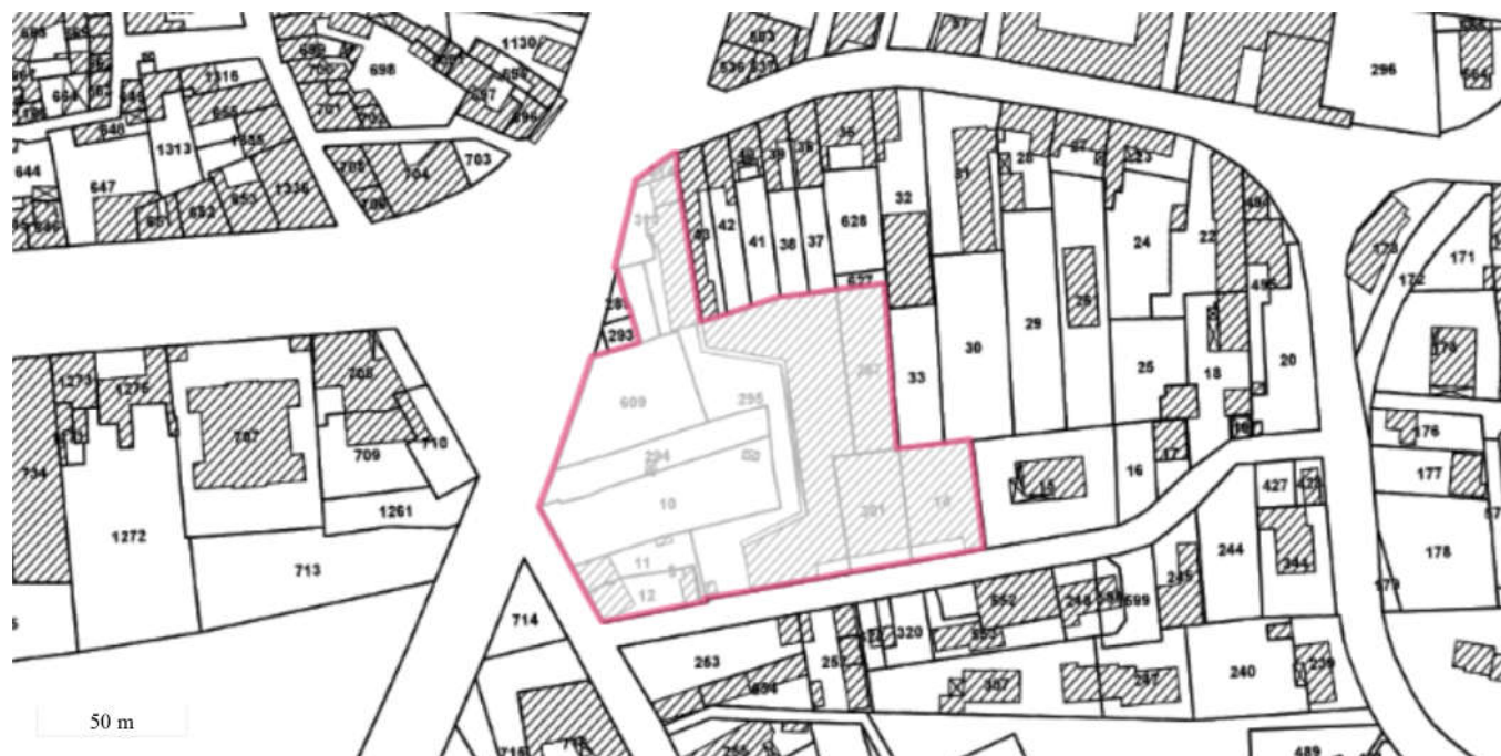
Périmètre du SIS Parcelles cadastrales - IGN